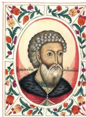
Иван III Васильевич положил конец ушкуйникам

В какой-то момент казалось, что они превратятся в особую закрытую касту. Ведь они даже собственный язык изобрели. Знаменитый боевой клич «Сарынь на кичку», с которым пару столетий спустя Степан Разин