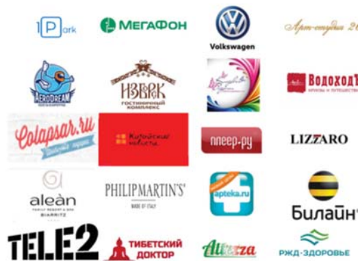
Список партнеров программы преференций для членов РПСМ

– бесплатный номер телефона технической поддержки ЭПБ на территории РФ