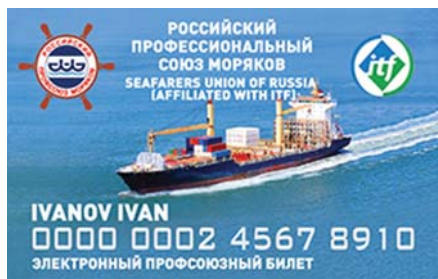
Так выглядит электронный профсоюзный билет